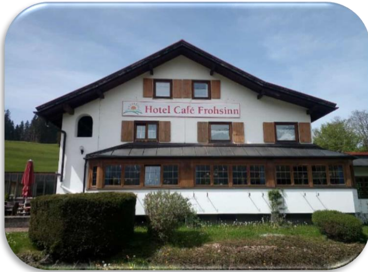
Parken und spätere Einkehr „Café Frohsinn“